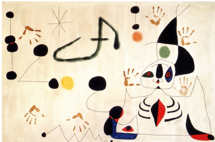
Femme dans la nuit de Joan Miro